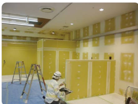
東京都多摩市 店舗仕上げ工事