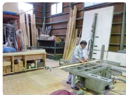
埼玉県戸田市 弊社加工場