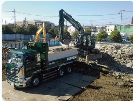
埼玉県戸田市 解体工事