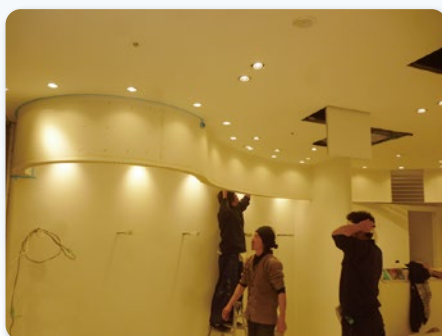
東京都渋谷区 店舗改修