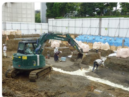
東京都千代田区 根伐工事