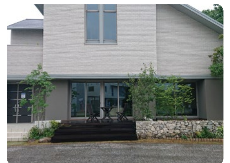
東京都立川市 外構工事