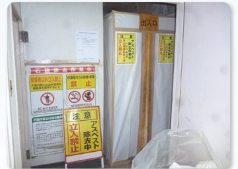
東京都杉並区 アスベスト撤去工事