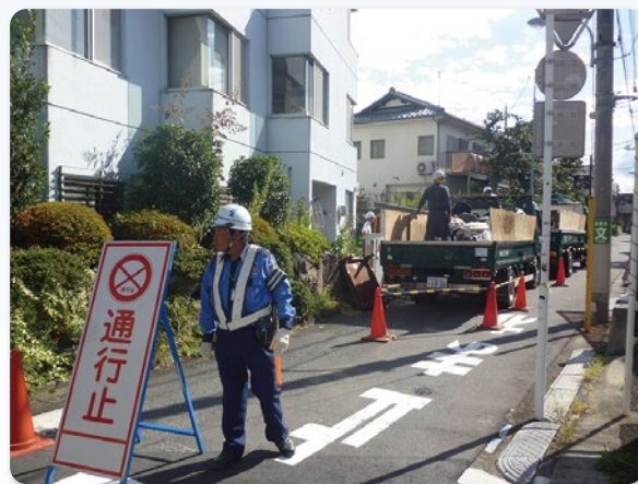
東京都杉並区 産廃集積状況